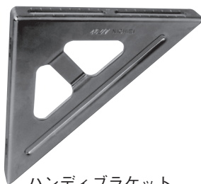
ハンディブラケット